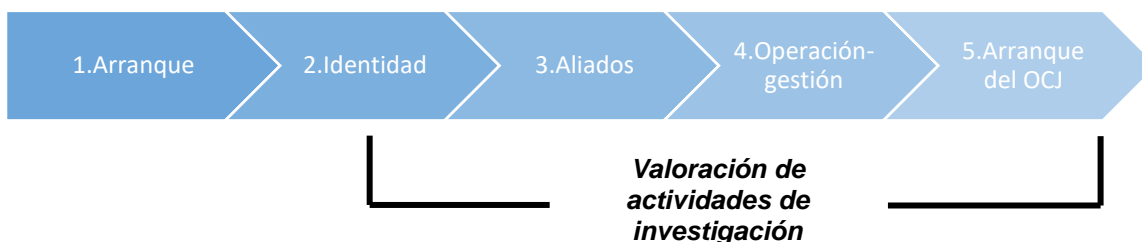
Figura 3: Fases en la etapa de investigación

La etapa de evaluación constituye la esencia del proceso de certificación. Esta etapa consiste en seis fases, de las cuales 5 corresponden a las fases 0 a 4 de la Guía de Gestión del OCJ. Adicionalmente, se llevará a cabo una etapa de verificación de los procesos de investigación, que correrá en paralelo como se establece en la figura 3: